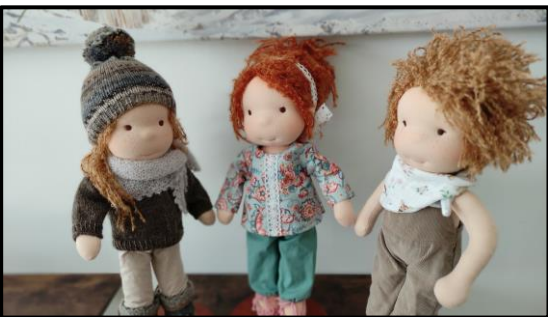
Grösse ca. 33 cm